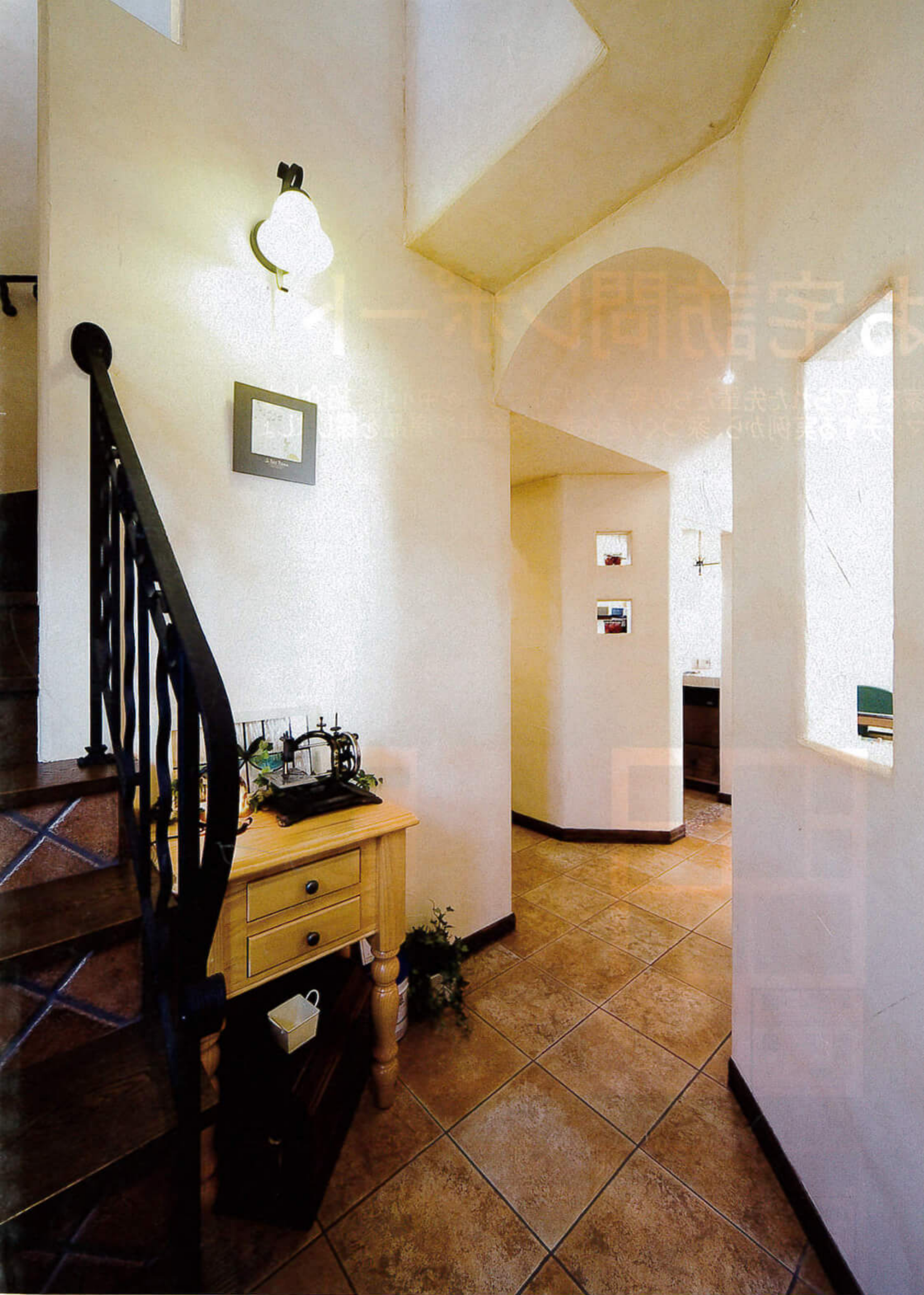
①テラコッタ調フロアにモザイクタイルと無垢材の階段、アイアン手すりが印象的な玄関ホール。随所に設けられたニッチもアクセントに