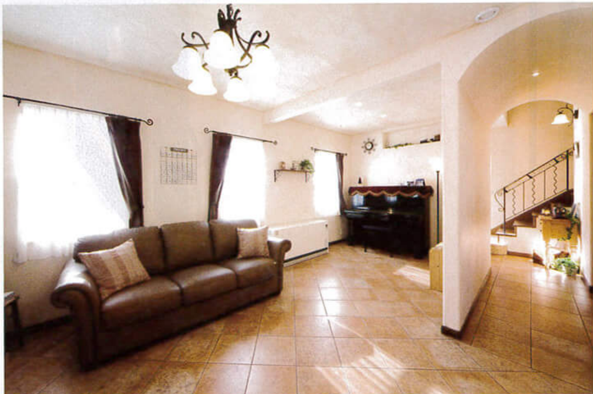
②リビングとオール天井の廊下のフロアタイルの張り方を変えることで、空間をソフトに分離

ナチュラル仕様は大きな決め手に。「新建材は時間が経つと劣化するけれど、自然素材の塗り壁やタイルなどは、時間を経ていくことで色合いも増し、それが味わいになります。家族と一緒に家も成熟していくのだと思いました」。 新築にあたっては、ホビールームとリビングをひと続きに。さらに1階はすべて扉のない開放的な設計に。「すべてオープンなのですが、夏の暑さエアコン1台でOKでした」。北海道生まれの高気密高断熱住宅なので、長く暮らすうえで大切な住宅性能も信頼していると語ってくれた。「取材・文/平沢 由佳」