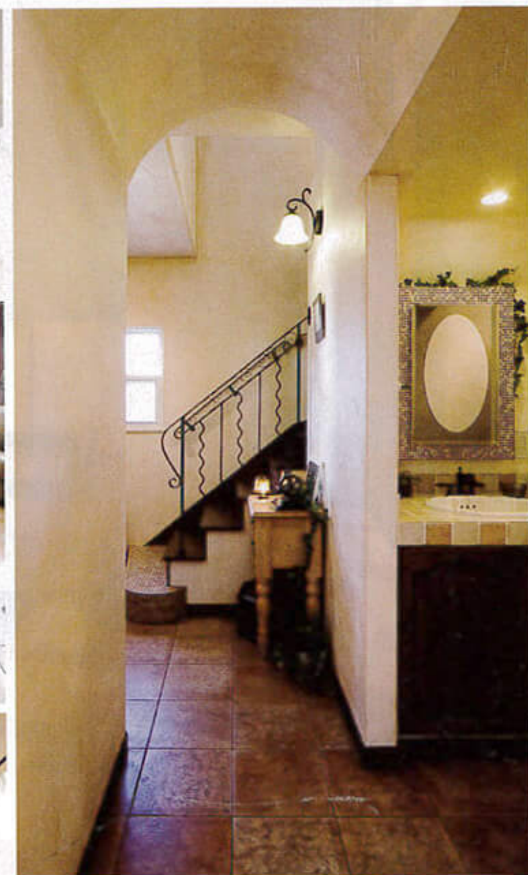
③上右/手塗りの質感が温もりを感じさせる室内壁と自然な陰影で雰囲気を高めるタイル、重厚なアイアン手すりが、オール天井の廊下を情緒たっぷりに見せる ④上左/キッチンカウンターには手焼き調タイルをコーディネート。仕切り壁にニッチを設け、調味料をディスプレイ ⑤左/キッチンから続くタイル張りのカウンターはパソコンコーナーに